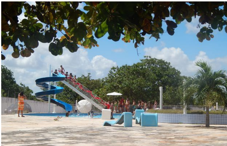
Estutura conta com piscina semi-olímpica e tobogão.

AGORA OS ASSOCIADOS E SUAS FAMÍLIAS PODEM GARANTIR A DIVERSÃO DOS FINAIS DE SEMANA NO COMPLEXO DE LAZER DO SINDICATO DOS SERVIDORES PÚBLICOS MUNICIPAIS DE NATAL - SINSENAT