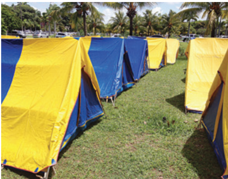
Acampamentos em frente à Governadoria pressionaram autoridades estaduais para o atendimento do pleito

A participação dos militares estaduais foi também fundamental para a aprovação do Projeto de Lei na Assembleia Legislativa. Durante o mês de maio deste ano, as discussões da Casa receberam a presença efetiva de policiais e bombeiros militares do Estado. O resultado? A aprovação do Projeto de Lei com unanimidade pelos deputados estaduais, no dia 20 de maio. As primeiras promoções já estão