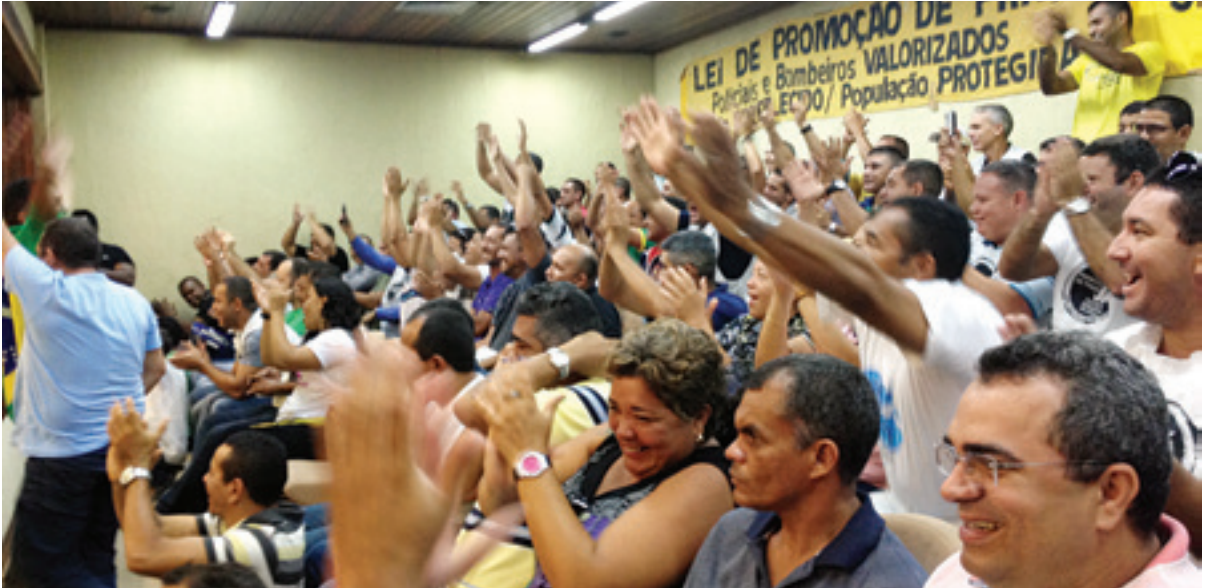
Praças e familiares comemoram a aprovação da Lei na Assembleia Legislativa