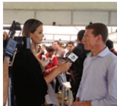
As ações dos praças em defesa da aprovação do Projeto de Lei tiveram ampla cobertura da imprensa local