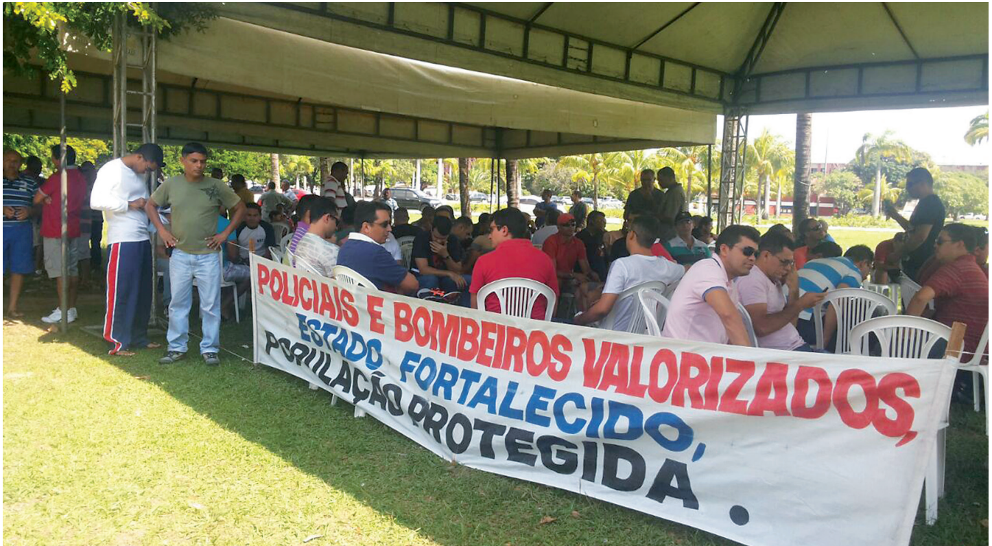
Políciais acampam em frente a governadoria pela aprovação da Lei nº 515/2014