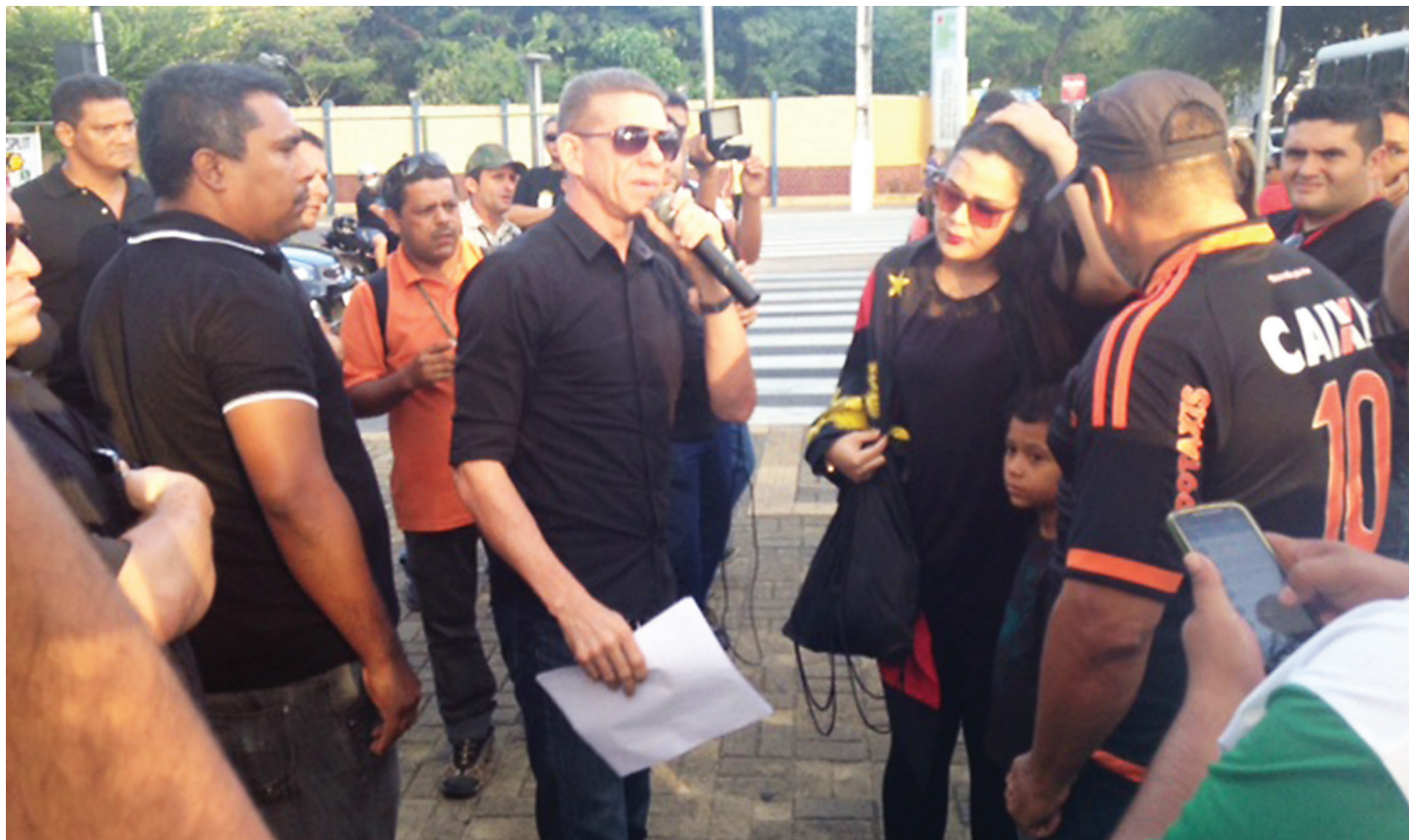
Polícia Militar realiza protesto pela crescente violência contra os PMS