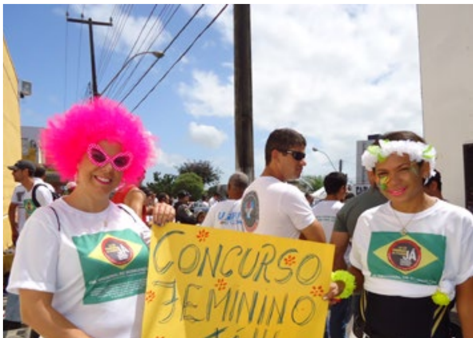
Diretoras participam ativamente dos atos públicos da Associação

SOMOS A ÚNICA ASSOCIAÇÃO DE PRAÇAS DO ESTADO A CONTAR COM A PRESENÇA DE MULHERES NA DIRETORIA, DIFERENCIAL QUE JÁ TEM DADO RESULTADOS POSITIVOS